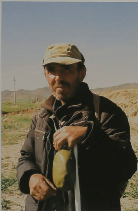
portrait shepherd who lets his cattle graze in mush