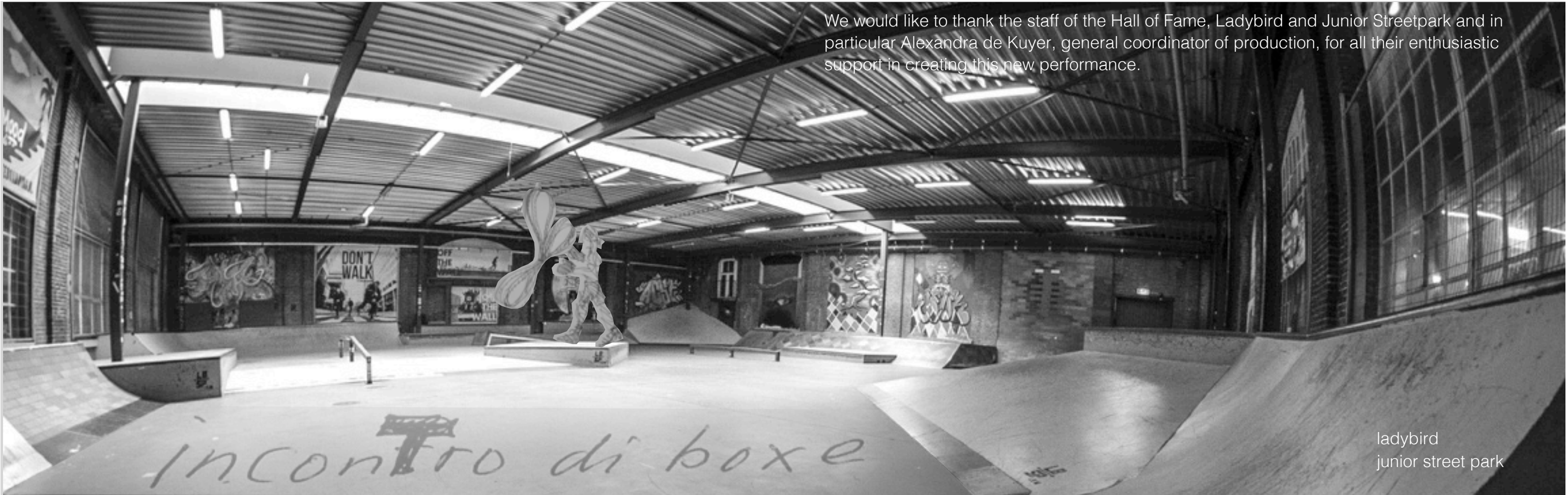
ladybird junior street park