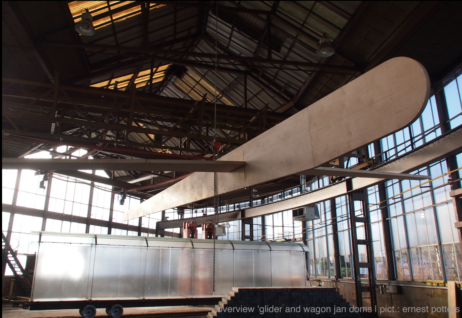
overview 'glider and wagon' Jan Doms