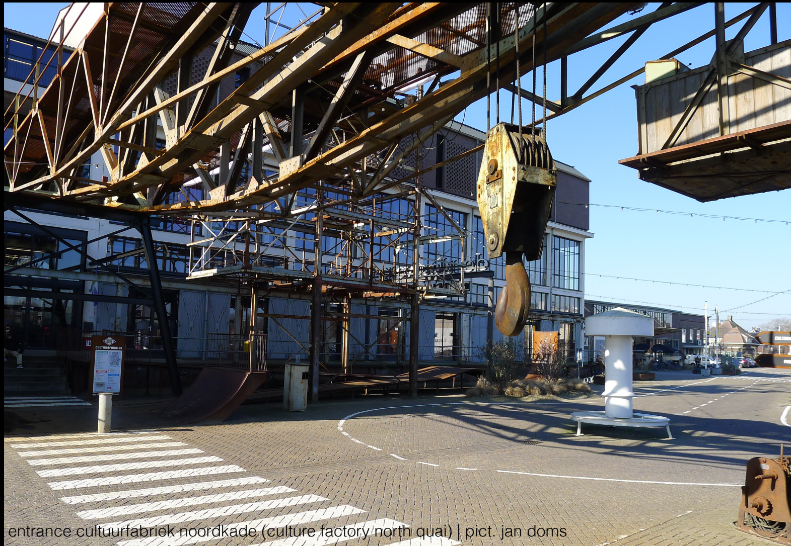
entrance cultuurfabriek noordkade (culture factory north quay)