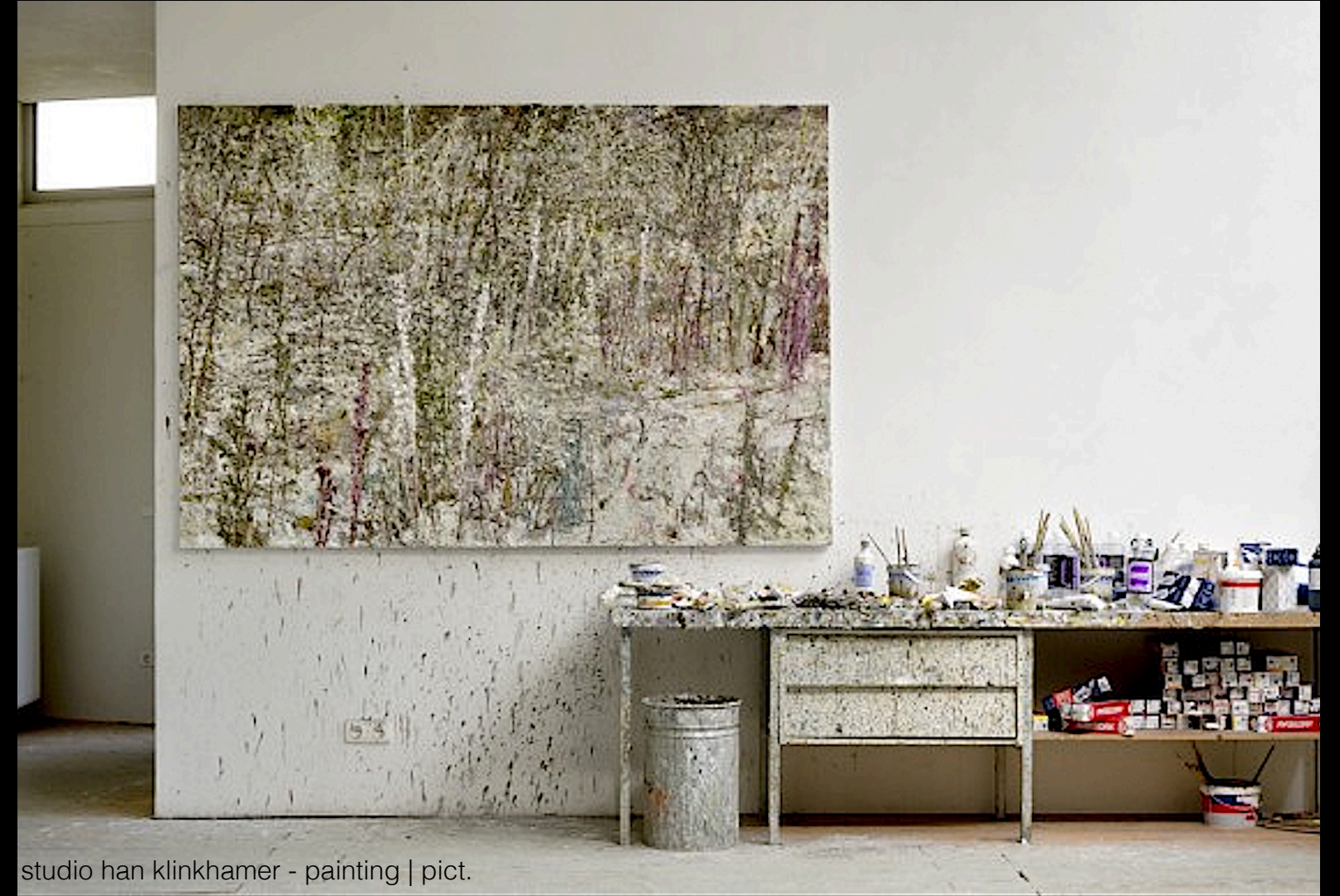
studio han klinkhamer - painting | pict.

Het werk toont de tijd van de materialiteit. Het voortdurend aanbrengen van nieuwe lagen verf, het wegschrappen ervan, het eindeloze proces van keuzes in compositie, toonwaarden, die worsteling van de kunstenaar, dit alles is uiteindelijk tastbaar en zichtbaar op het oppervlak van het schilderij.